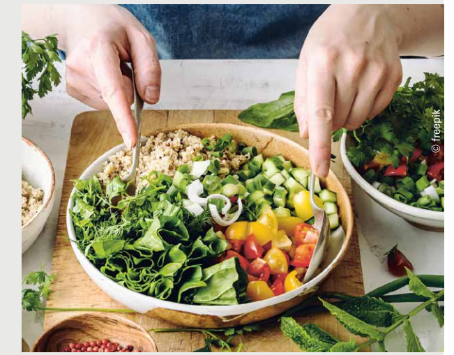
Die diesjährige „Frühjahrskur“ läuft bis Ende Mai.