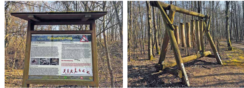
Der Trimm-Dich-Pfad befindet sich in der Nähe des Wanderparkplatzes an der Kaiserstraße.